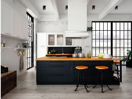
KANLUX S.A. (kat 27571) RITI GU10 B/G + TOMI LED5W / LDC (Polar)

Luminaire: KANLUX S.A. (kat 27571) RITI GU10 B/G + TOMI LED5W Lamps: 1 x TOMI LED5W GU10-WW